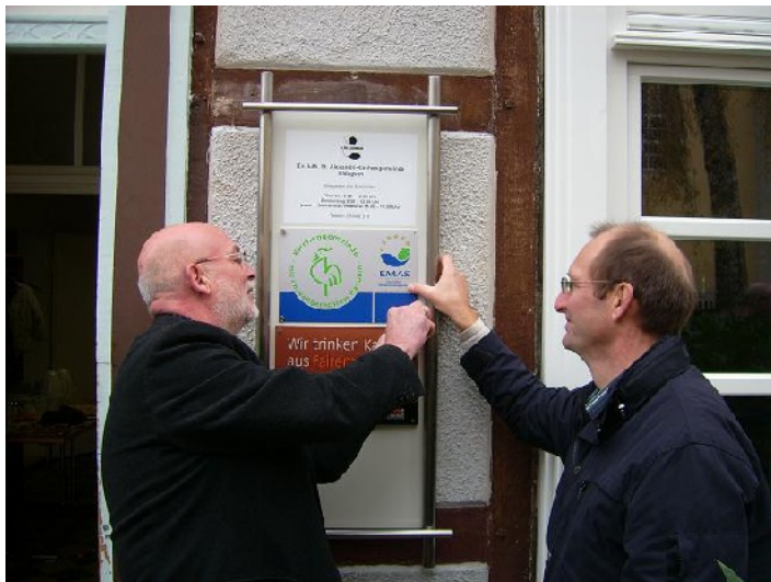
jetzt ist es auch öffentlich