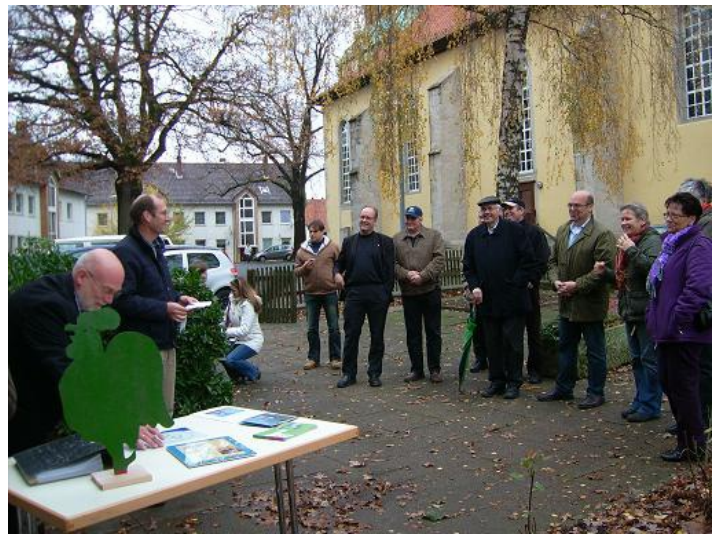
einige Besucher waren nach dem Gottesdienst dabei