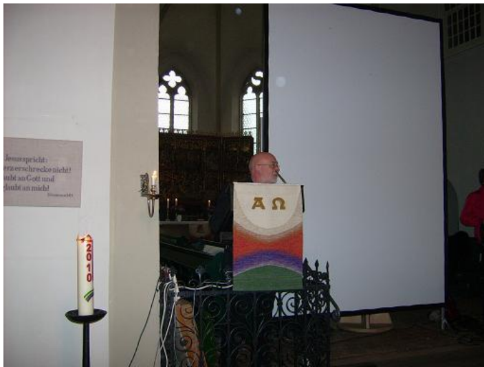
D. Meusel – Ansprache zur Anbringung des Schildes