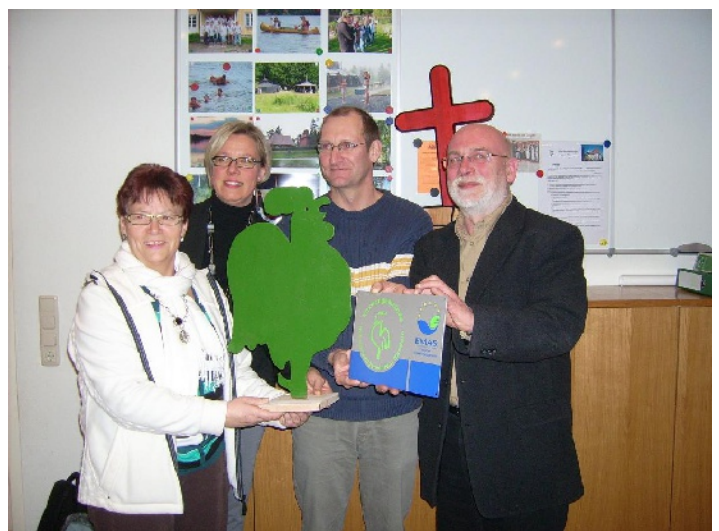
... hier mit EMAS-Schild